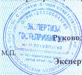
схема сертификации 2, инспекционный контроль в 2025 г., в 2026 г.